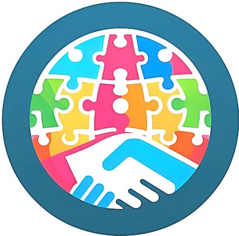
Mogelijk te gebruiken logo op websites (2)