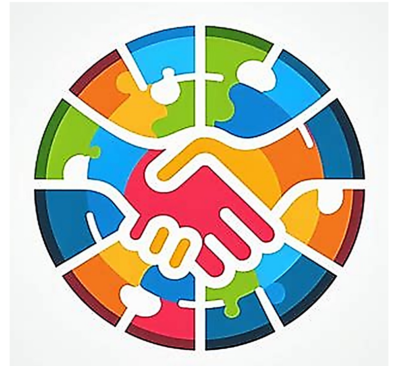
Mogelijk te gebruiken logo op websites (1)

Prof. Pearl Dijkstra, Erasmus Universiteit Rotterdam