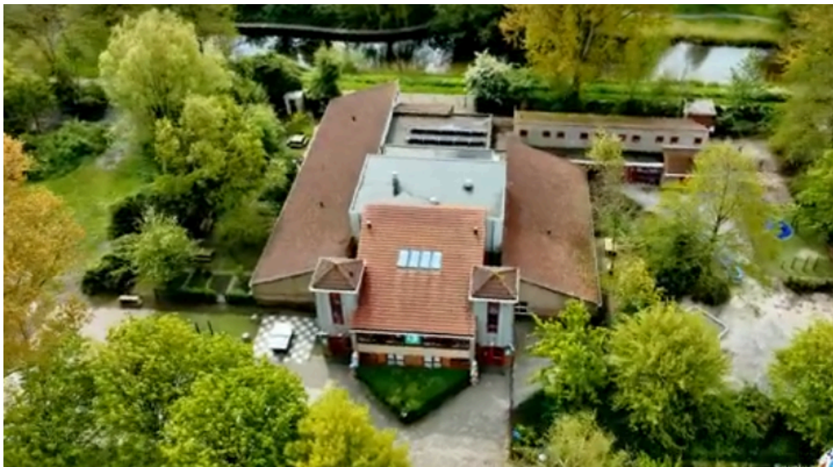
(Groene leeromgeving van basisschool De Keerkring in Schagen)

Samenwerking met de schoolbesturen (PO, VO en MBO) en verenigingen binnen de gemeente Schagen. Subsidie voor vergroening van het onderwijs. Samenwerken met groene organisaties, overheden en bedrijven.